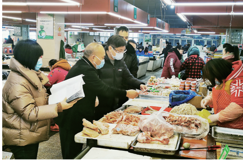
图为工作人员正在检查市场内的冷链食品。

安全管控指标,我市已连续17周全省排名第一。”该工作人员说。此外,我市建成启用临海、温岭两个公共集中监管仓,实行岗位24小时轮班制,实现公共集中监管仓有序运行。“通过台州口岸进入或市外流入我市进行储存、加工(分包)、销售的进口冷链食品,如不能提供规范化核酸检测和消毒证明的,一律运抵集中监管仓,进行核酸检测和预防性全面消毒。”截至目前,临海公共集中监管仓共受理42批次进口冷链食品,共计30.64吨,其中经过消毒检测已出仓34批次,计21.15吨。温岭公共集中监管仓受理3批次,共计33.93吨。