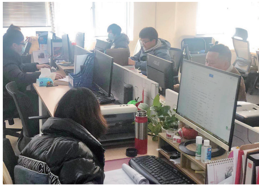
图为新媒体运营师工作现场。

平台促销、线上带货、宣传推广……“吸睛”过后,各个新媒体平台“悄悄”地赚起了钱。