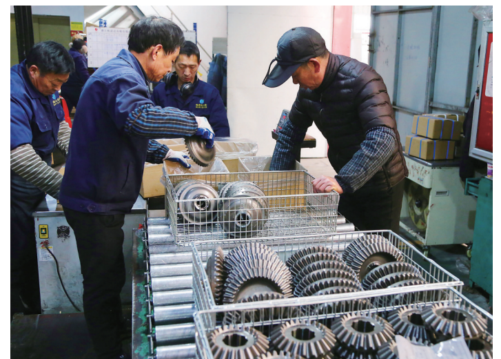
公司内一派忙碌生产的景象。

2020年,公司总产值17089万元,同比增幅46.05%,在玉环干江镇200多家企业中遥遥领先。