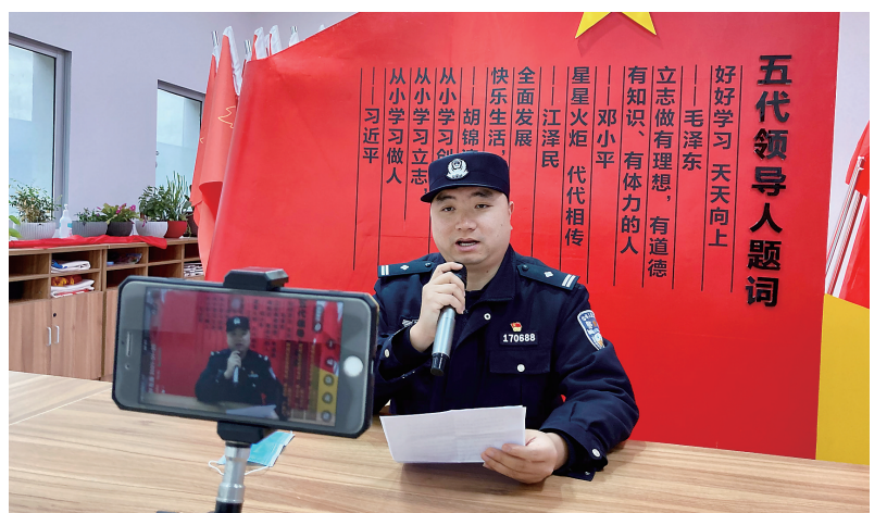
警校联盟助力平安寒假

隐患就是命令。该所抢修班马上制定应急抢修方案,抢修停电范围涉及5台公变、1台专变。移动式UPS电源在抢修中安装方便,易于操作,能提供应急电源,因此在此次方案中,该所向施工队借用6台移动式UPS电源,同时短信通知相关用户维