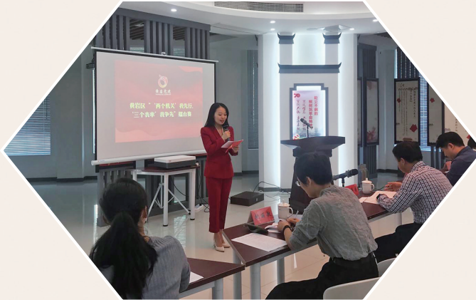
“双建示范我先行,三个表率我争先”机关党建工作擂台赛。

如今,黄岩一以贯之擦亮连续18年坚持不懈的“橘乡发展论坛”,深化完善“机关党员干部政治标准量化考评办法”“永宁企业家”等机关党建特色品牌,深入开展机关党建示范点、先锋党支部、清廉机关示范点创建评选活动,三年来,全区累计打造市级示范单位15个,区级示范点25个,有效推动了机关党建从全面规范向全面示范,从点上“盆景”向面上“风景”转变。