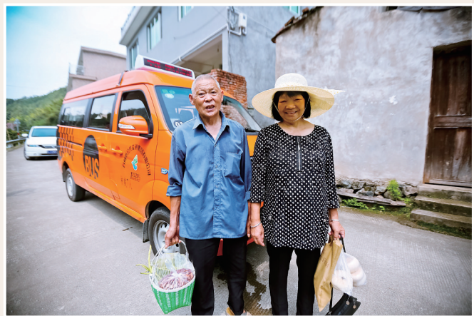
树立“以人民为中心”工作理念,开通“村村通”微公交服务偏远乡村群众。