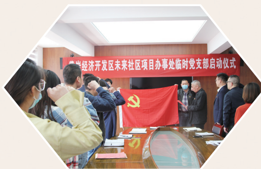
黄岩经开区未来社区项目临时党支部启动仪式。

因此,黄岩区行政服务中心、黄岩区院桥镇便民服务中心入选全国首批政务服务“好差评”国家标准试点单位,这充分说明黄岩通过机关党建赋能政务服务的创新举措获得了国家层面的充分认可!