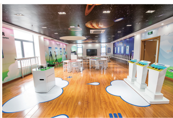
气象局“永宁天境”党建示范点