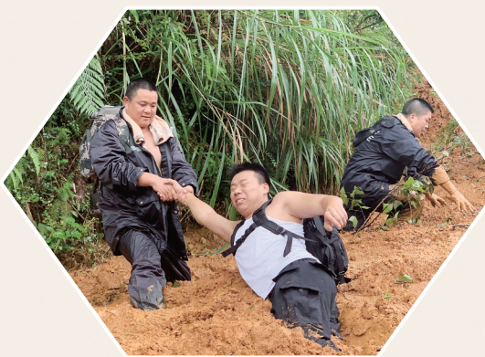
黄岩公安分局巡特警大队先锋队赴泥石流抢险一线。