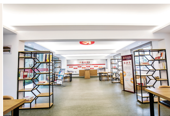
行政执法局“橘乡红管家”党建示范点