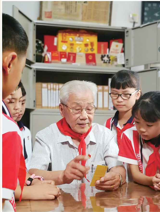
离退休老党员为少先队员讲革命故事。

近年来,黄岩区坚持政治引领,围绕中心服务大局,聚焦建强战斗堡垒、深化干部队伍建设、强化正风肃纪等方面工作,推动全区机关党建不断向纵深发展,不断取得党建工作新成效,为该区奋进“永宁江时代”夯实根基。