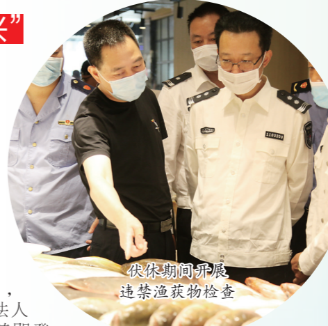
伏休期间开展违禁渔获物检查

“立即停船,接受检查!”8日凌晨0:32,在一江山附近海域,执法人员发现1艘正在作业的渔船,