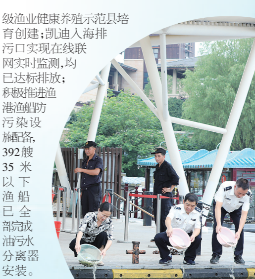
在灵江等开放性内河流域开展夏季渔业增殖放流活动,保护渔业生态资源。

一枝一叶总关情。去年,该市成功创建省级水产健康养殖示范场(点)6个,完成率150%,超额完成创建任务,并入选省