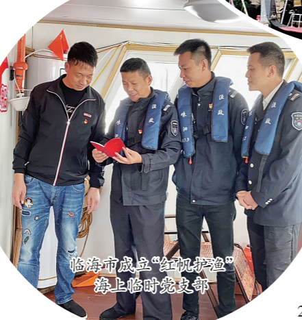
临海市成立“红脚岩渔港”海上临时党支部