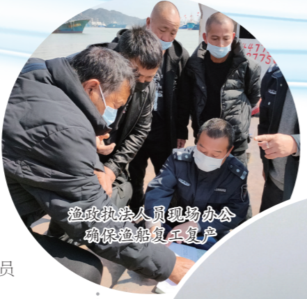
渔政执法人员现场办公确保渔船复工复产

工程建设取得新进展,得益于该局在疫情防控形势持续向好时,第一时间按下各大项目复工“加速键”,制定每月工作细化表,每个项目由一位班子成员牵头主抓,加快重大项目建设。截至去年12月,该局共完成水运基础设施建设投资28665万元,完成东矾二级渔港扩建(升级改造)工程投资额1180万元。