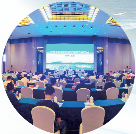
2020年8月20日,台州市养殖水产品合格证实施工作现场会在临海举行。