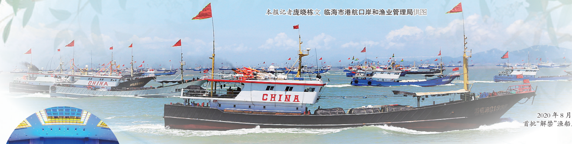
2020年8月1日12时,首批“解禁”渔船启航出海。