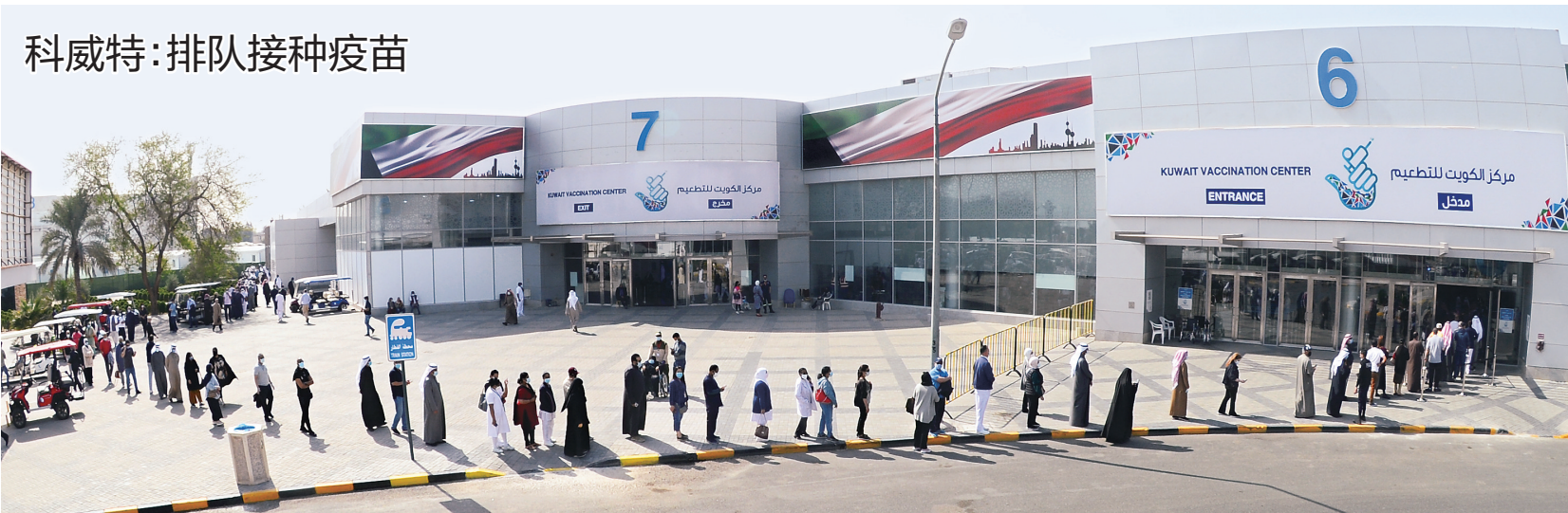
2月4日,人们在科威特哈利利省的疫苗接种中心外排队等候。科威特卫生部2日表示,近来该国日增确诊病例数、重症监护室病例数、新冠病毒检测阳性率都不断上升,这与人们进行国际旅行、参加聚会有关。卫生部呼吁人们尽量不要旅行、不要聚集。

加拿大反恐专家认为,极端主义和恐怖主义组织的威胁和暴力言行有扩散趋势,严重威胁加拿大国家安全和稳定。