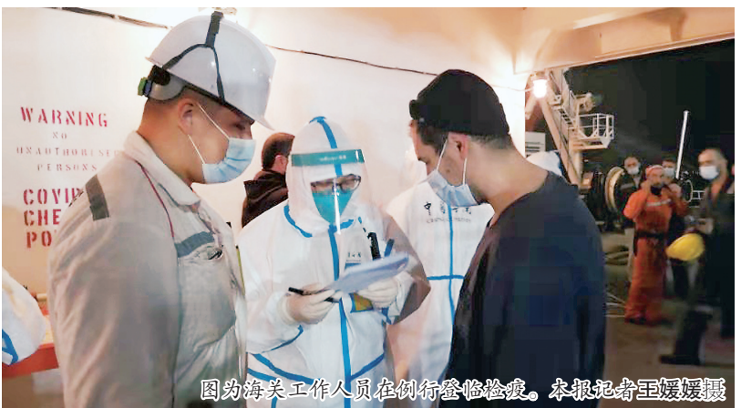
图为海关工作人员在例行登临检疫。

本报(记者王媛媛)2月16日傍晚6点多，一艘满载煤炭的入境货轮缓缓停靠在玉环大麦屿港口。台州海关驻玉环办事处业务二