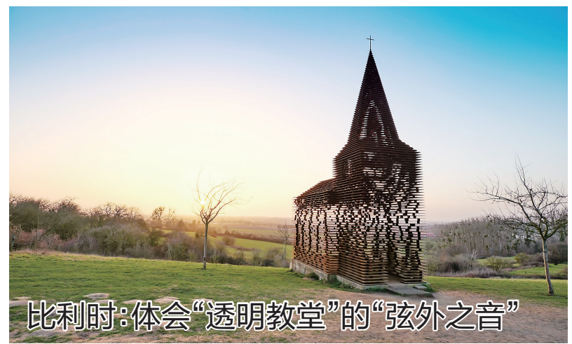
比利时:体会“透明教堂”的“弦外之音”

2月24日,美国纽约一座大楼外的美国国旗降半旗悼念新冠逝者。美国约翰斯·霍普金斯大学22日的统计数据显示,美国累计新冠死亡病例超过50万例。美国总统拜登当天发布总统公告,下令美国境内所有联邦建筑和军事设施降半旗5天,以悼念新冠逝者。