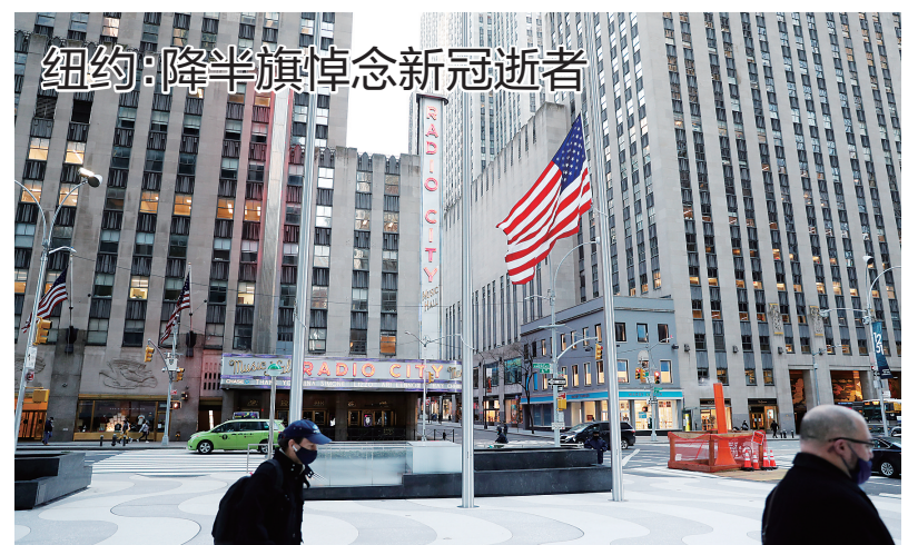
纽约:降半旗悼念新冠逝者

美国《布朗政治评论》杂志评价,运用军事力量,随后施加暴力,以建立外交和政治主导地位,“美国在历史上和当代都是最臭名昭著的罪魁祸首”。(新华社北京2月25日电)