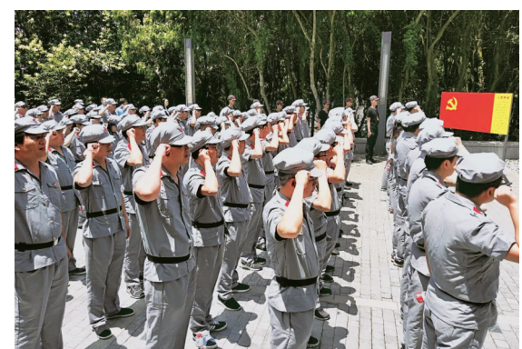
坞根镇把红色资源串点成线,推出深度体验游。