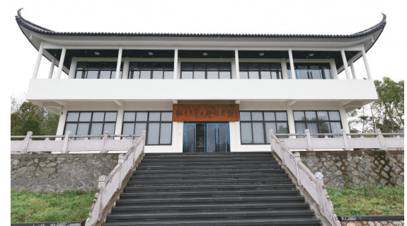
红十三军二师纪念馆。

这座纪念馆,她并不陌生。小学五年级时,她曾是纪念馆的一名“小红军”讲解员,向游客讲述红二师的历史。如今,她已是一名大学生,为了完成“了解家乡、记录家乡”的实践作业,她再次走进纪念馆。