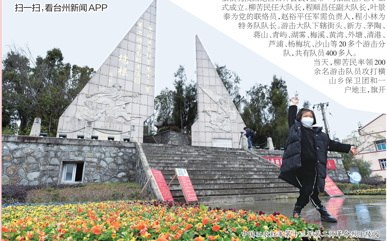
中国工农红军第十三军二师革命烈士陵园