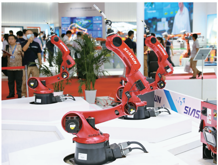
这是在第22届中国国际工业博览会上拍摄的天津新松机器人自动化有限公司的机器人智能焊接系统(2020年9月15日摄)。