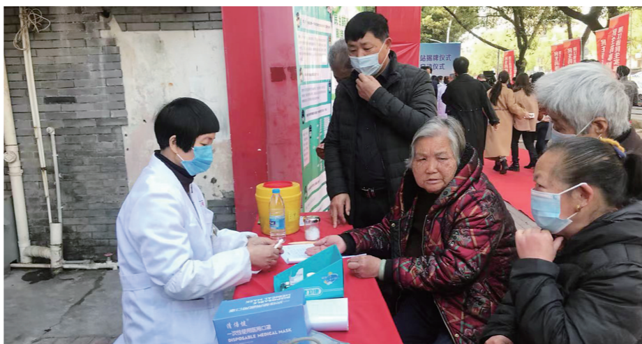
图为瑞人堂药店民生药事服务站为群众免费测量血压、血糖。

据了解,今年我市将选择一批具有一定药事服务基础的优质零售药店作为建设主体,陆续建成36家民生药事服务站。