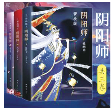
台州市图书馆馆藏信息:普通文 献借阅室I313.45M638

在日本,梦枕貘可谓家喻户晓,被誉为“日本魔幻小说超级霸主”,素有“造梦人”之称。 读梦枕貘的《阴阳师》,我马上会联想到蒲松龄的《聊斋志异》。两者均把读者带入到人鬼神共处世界。在这别样世界里,“鬼狐有性格,笑骂成文章”。我想,梦枕貘也定然看过《聊斋志异》。他在《阴阳师》写作结构上,采用“卷”的形式。然后,在卷里分若干个类似于章节的小故事,每个故事有完整剧情,故事间各不关联。 所不同的是,《阴阳师》自始至终只有安倍晴明这一主角,与之贯穿始终的是其朋友源博雅。其他都是众多不同的求助者、被解救者和被识破者。 用大量的对话营造艺术空间和故事情节,这一叙述手法在《阴阳师》里尤为明显。每个故事开头基本是晴明与博雅梦吃般的对话;之后,在晴明追问下,求助者回忆自述;接着,晴明与鬼妖现形者互问答;最后,博雅问疑,晴明或直或曲地回应。就这样,“言语间,破解了一切真相,挫败了种种对峙,维护了各界和平。这晴明与博雅,跟狄仁杰与元芳、包拯与展昭的角色搭配极为相似。无非把“元芳,你怎么看”换成了更多的——“要不要一起去确认一下?博雅”“唔,嗯,那走吧!” 《阴阳师》,通篇唐风阵阵。不管是描写到的建筑、器物、服装还是乐曲、诗歌、佛语,甚至杨玉环,都充盈着浓郁的中国古风,让人有一种亲切感。中日一衣带水,同属东亚文化圈。唐朝时期,中日两国交流频繁,日本受汉唐文化影响深刻。作者梦枕貘本身就非常喜欢中国文化,爱看中国书籍,从小就对《西游记》迷倒,还经常到中国感受宗教文化和山川奇景。 但梦枕貘毕竟是日本人,书中体现的文化元素除了中国唐风,也有浓浓的日本味。两种文化交融,有点难分彼此。樱花、菊花、清酒、蝉鸣,月光、雨点、花丛、笛声,色调、声音的变化,衬托出静谧伤感的唯美画面,更体现了阴阳师的禅意人生。 梦枕貘还故设悬念,通过晴明之口说出一些富有哲理的话,如“我们在如此宽广辽阔的大地,一直在为寻找而不断地漂泊着,从天涯到海角”“所有一切的你,存在于此都是对”“世间一切事物,连同人的念想本质上都是空”,等等。这些都渗透着作者对宇宙、人生、宗教的感悟,教人自悟,发人深思。 大凡作家都有颗悲天悯地之心,即使笔下之人物曾邪恶,却总给其向善的奢望机会。梦枕貘也不例外。他将鬼魅世界中的蛇、蜈蚣、犬、牛等诸怪,刻画得如此令人怜悯。它们对生的渴求,情的痴恋,一如人间,甚至有过的。尽管有的最后灰飞烟灭,但那种爱过人和被人爱过的知否知否,凄然四周。读后,有一种情女幽魂之感。 梦枕貘认为世界上最短的咒就是名。所谓咒就是束缚。当我们看穿红尘,挣开束缚,哪怕追逐画皮一样的月色寂寞,也是一只勇敢的飞蛾。 星晴明月照山野,风博雅弦望君乐。在樱花纷飞、灯火阑珊里,仿佛听见拿着符的安倍晴明在说:“博雅,你我缘分始于笛声,今日也让我用笛声送你踏上归程。” 来来往往的阴阳两界,何曾隔阂过?正如白天与黑夜总是那么相通。