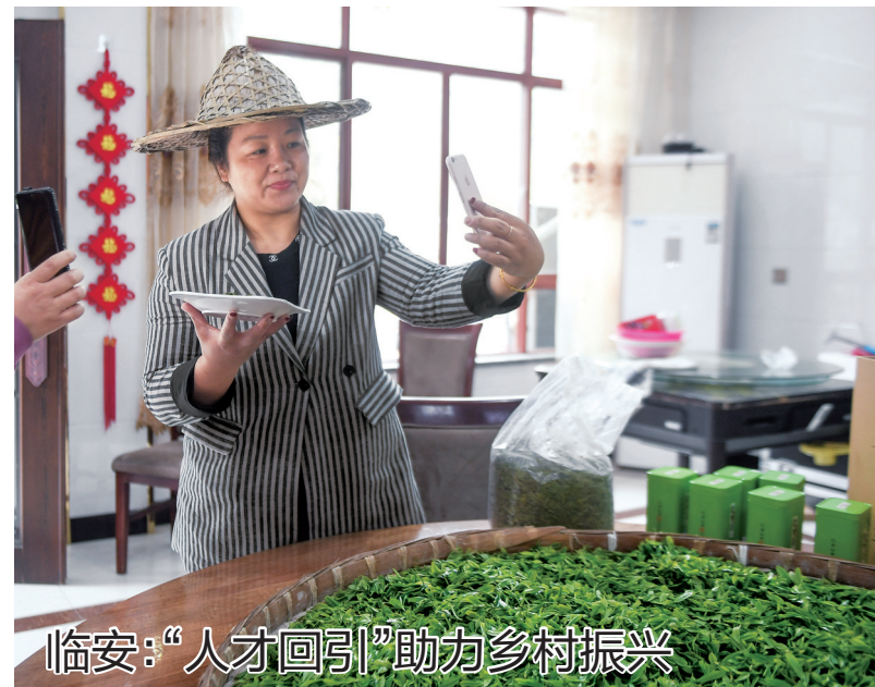
临安:“人才回引”助力乡村振兴

3月31日,杭州市临安区龙岗镇龙井村的致富带头人正在进行直播,向网友推荐新鲜春茶。