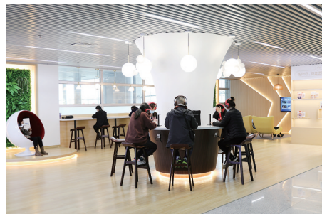
台州市图书馆今年新增了有声阅读空间。

台州的几大高校都有自己的图书馆,与台州市图书馆的合作,让各大高校的校内阅读体验更加多元、便捷。