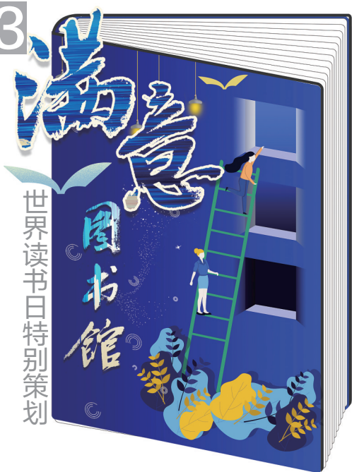
世界读书日特别策划 图书馆