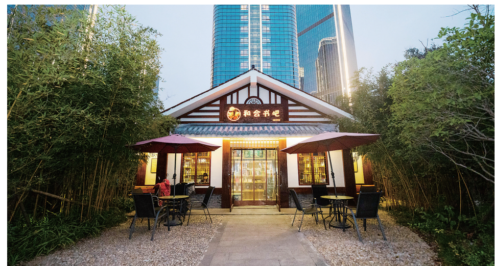
2016年至今,我市共建成“和合书吧”101家。

台州学院、台州职业技术学院、台州广播电视大学图书馆都已纳入全市借通还平台,在这些学校的校内平台,读者们都可以享受“一馆办证,多馆借书;一馆借书,多馆还书”的便利,如今各大高校的借阅点已经成为“全市图书馆业务一张网,数据一朵云”的一部分。据了解,2020年,新纳入高校馆际借通还图书307.14万册,服务覆盖读者人群达111万余人。