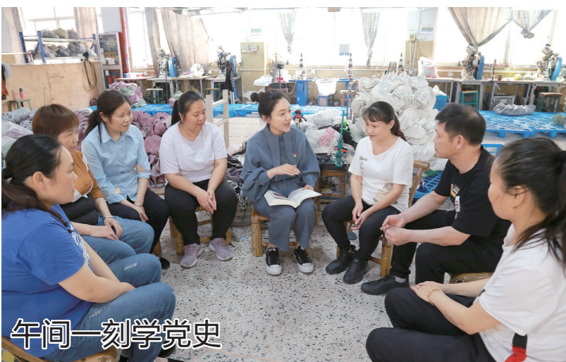
午间一刻学党史 5月8日,温岭城北街道服务专员利用“午间一刻”,把“微党课”送进浙江富明星体育用品有限公司的车间,在讲述百年党史的同时,鼓励一线员工立足岗位不懈奋斗,为企业发展迸发红色动力。

近日,在温岭市青少年宫举行了一场老少同绘“百年征程·百米长卷”、“五老”讲党史活动。离退休老干