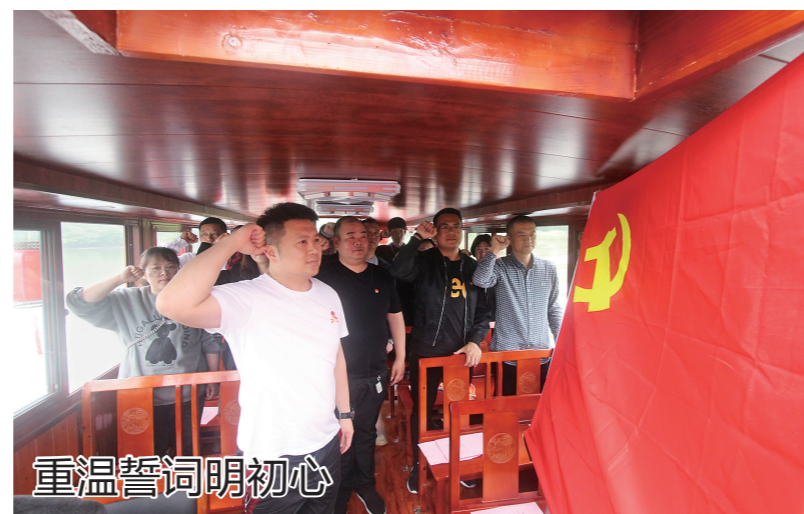
重温誓词明初心 为庆祝建党100周年,日前,路桥街道巡察联络站党史现场学习教育活动在螺洋街道水滨村水心草堂举行。水滨红船上,各村社区村监委员会主任、巡察联络站站长及经济合作社理事长进行宣誓。

想上下功夫,在“先行”征途上下功夫,扎实推进党史学习教育。依托9个全现场教育基地,以重温一次入党誓词、聆听一个革命故事、参观一次红色遗迹为主题党日活动内容,市委老干部局组织全市627个离退休干部党支部参与党史学习教育,并畅谈对“建党百年新成就”的心得感悟。目前已有300余个离退休干部党支部组织了学习活动,并征集感言700余条。