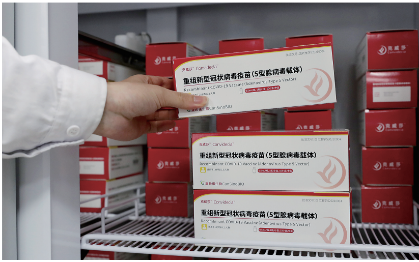
5月18日,在上海市徐汇区凯旋南路接种点冷链室,工作人员从冰箱中取出腺病毒载体疫苗。

新华社上海5月18日电(记者龚雯袁全)全程只需一针的新冠疫苗正在上海多个区的接种点陆续开打。同是新冠疫苗,接种一剂的腺病毒载体疫苗和两剂的灭活疫苗有什么区别?对于接种年龄又有哪些要求?接种的人多不多?记者实地走访寻找答案。