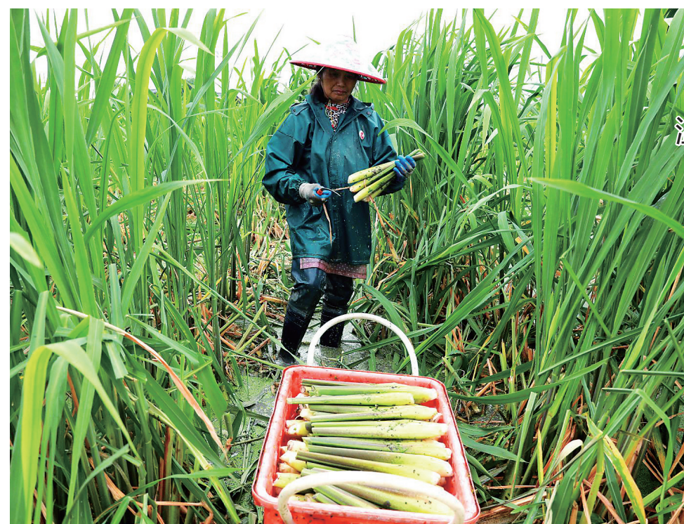
温岭茭白走俏市场

临海市市场监管局提醒,市民在购买品牌产品时,要选择正规店铺,并保存好相关购物凭证,避免因购买假冒伪劣产品造成经济损失。如发现制假售假等违法线索,请及时拨打12315进行投诉举报。