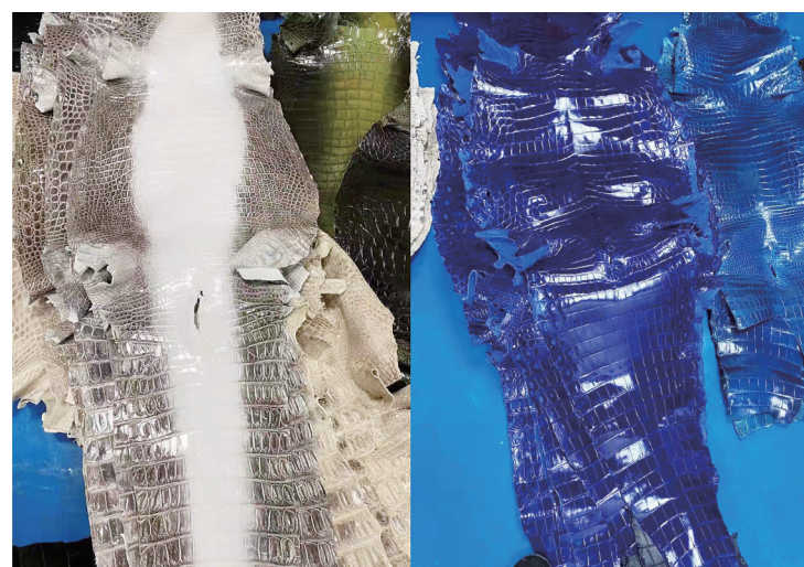
鳄鱼皮加工半成品。