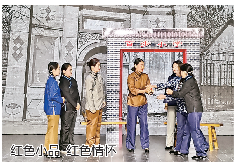
红色小品 红色情怀

众、深入基层、深入人心。本次策划拍摄微电影《打盐廩》,是弘扬红色文化、传承红色基因的重要举措,是开展党史学习教育的创新之举。据介绍,微电影《打盐廩》生动再现了黄岩西乡农民斗“盐廩”,为革命事业抛头颅、洒热血的感人事迹,并通过本地人参演本土题材微电影的形式,使党员群众更加深刻感受到革命先烈敢于斗争、英勇不屈的崇高品德,也更加懂得革命历程的曲折艰难和胜利的来之不易。