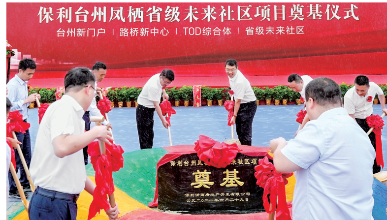
保利台州凤栖未来社区项目奠基仪式。