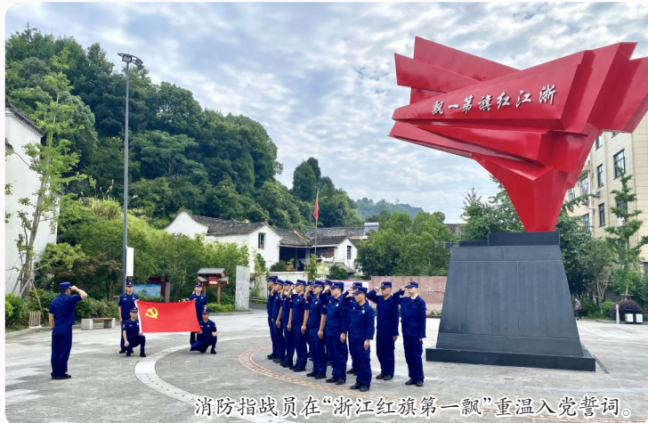
消防指战员在“浙江红旗第一飘”重温入党誓词。