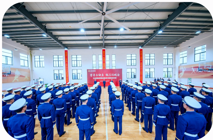
2021年全市消防救援队伍队列会操暨党纪党规令纲要知识竞赛现场。