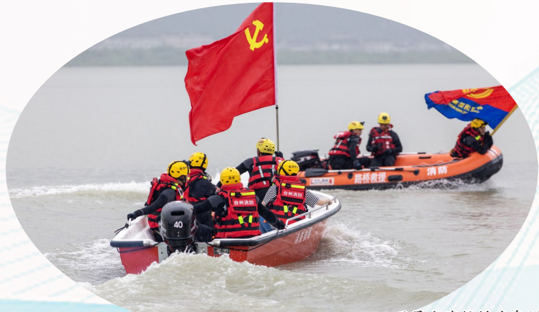
开展水域救援应急演练。

支队依托春潮路特勤站组建山岳、水域、高层、地震专业队,并确定12名队员进行脱产、跨区域专业训练,依托工人西路消防救援站组建石油化工专业队,依托新安南街消防救援站组建大跨度大空间专业队,积极打造“水、陆、空”三位一体救援力量体系,全面夯实专业处置能力。