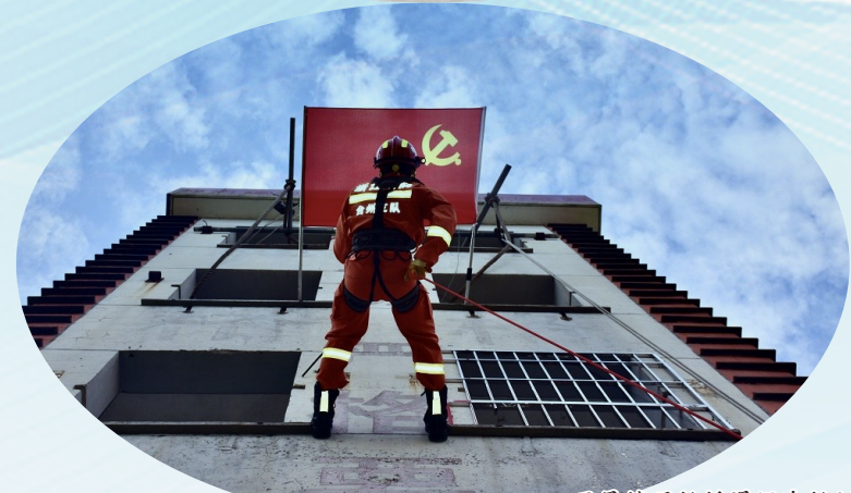
开展楼层救援滑绳自救训练。