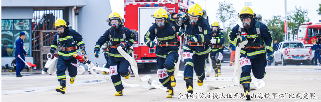
全市消防救援队伍开展“山海铁军杯”比武竞赛。

学党史,悟思想,办实事,开新局。今年以来,台州消防救援队伍以党史学习教育为引领,深入学习贯彻习近平总书记新时代中国特色社会主义思想,以习近平总书记训词精神为指导,以忠实践行“八八战略”为统领,紧紧围绕“大应急”“大安全”理念,对标“应急救援主力军和国家队”的定位,大力弘扬大陈岛垦荒精神,着力强化党建引领队伍建设,发挥应急救援“压舱石”作用,数字赋能助力火灾防控,践行“六项举措”优化营商环境,以“敢担当、立潮头”的姿态争创台州建设社会主义现代化先行市的“排头兵”,对党忠诚、纪律严明、赴汤蹈火、竭诚为民,是党和政府放心、人民满意的队伍。