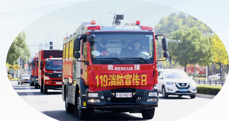
119宣传日,消防车全城巡游宣传。