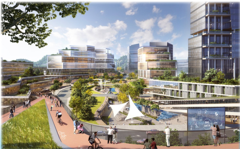
中央绿谷公共空间,可供市民骑行、娱乐。(效果图)