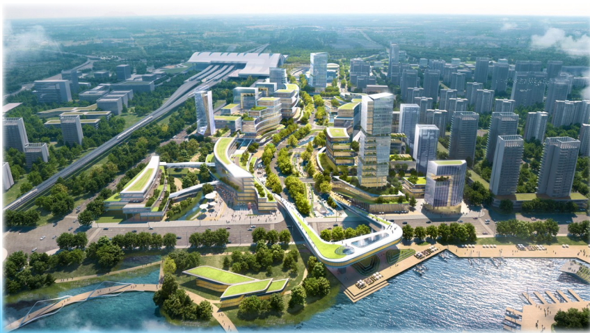
台州云谷,花园商务街区与地标楼宇相得益彰。(效果图)