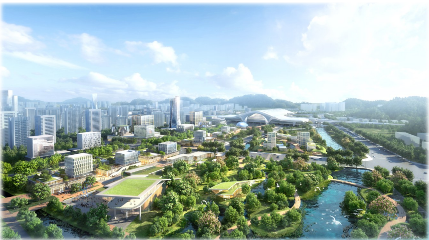
创享汀洲,与自然生态无界交融的文创商业街区。(效果图)

当前,“二次城市化”滚滚而来,从零走向未来的高铁新区,将擎起时代的接力棒,继续“上演”精彩的台州故事。