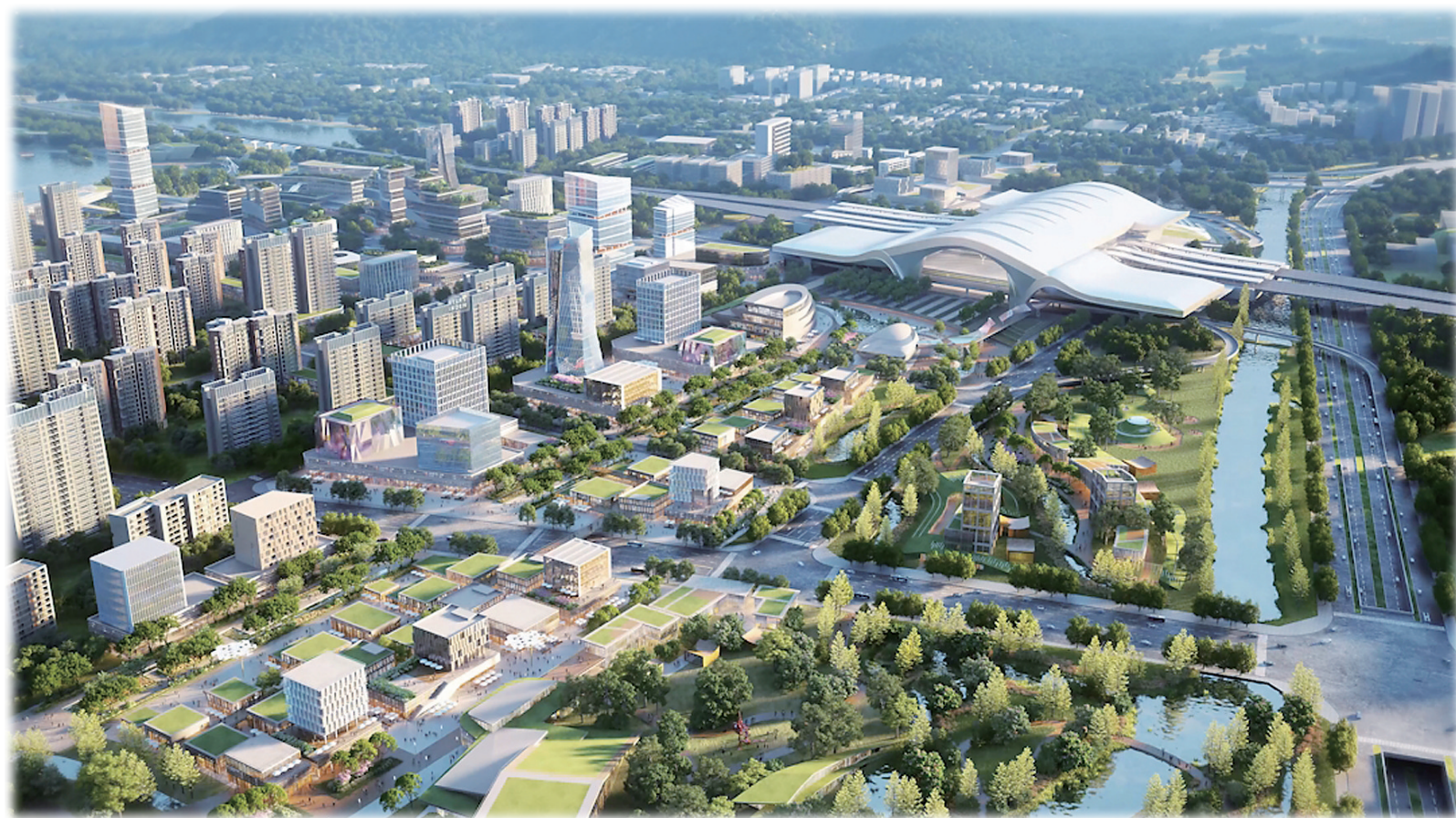
高铁台州站站前一景。(效果图)