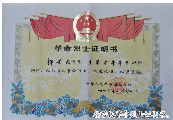
柳苦民革命烈士证明书。