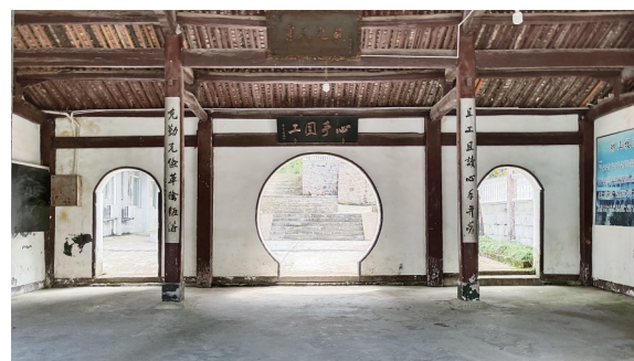
祝相公殿改成的学校学生集会的地方。