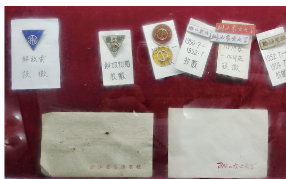
不同年代的琳山学校校徽。