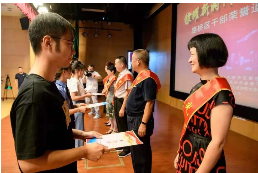
“银耀新时代·接力再出发”路桥区干部荣誉退休“师徒结对”仪式。