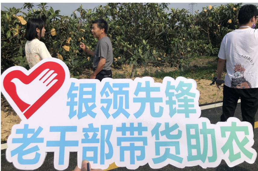
桐屿街道开展“银领先锋·老干部带货助农”志愿服务活动。