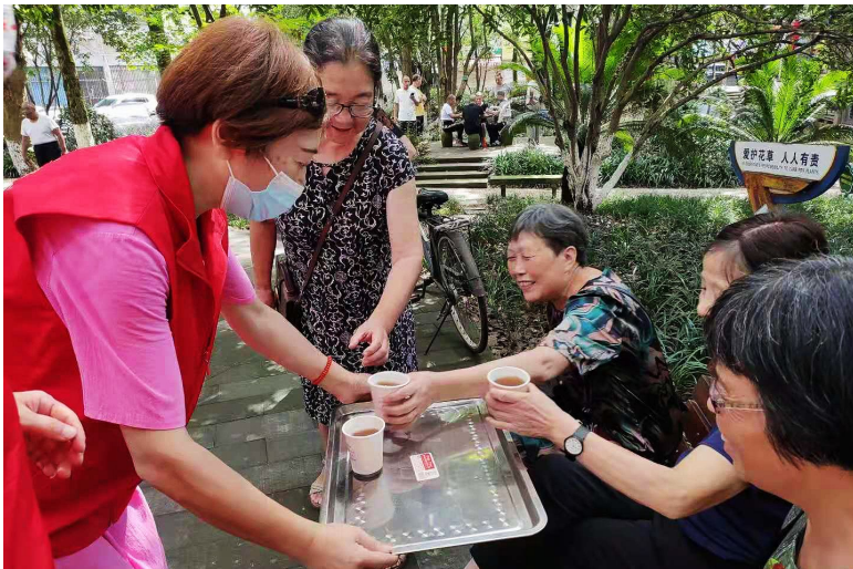
路桥区老年大学学员开展“送凉茶公益活动”。

讲好党史故事,当好薪火传人,老干部们在传承红色基因、赓续精神血脉的路上,一路前行。