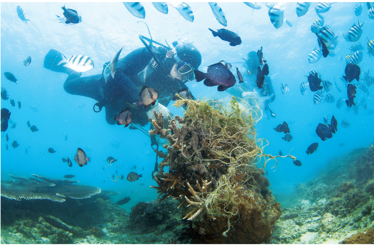
清理海洋垃圾 保护生态环境

根据新选举制度安排,在选委会的1500个席位中,共有325人已获裁定有效登记为选委会当然委员,并有156人获裁定有效提名当选为当然委员。另外,有603名候选人自动当选,412名候选人于19日角逐364个席位(由于立法会议员尚未举行换届选举以及部分当然委员身份重叠等原因不足1500人)。