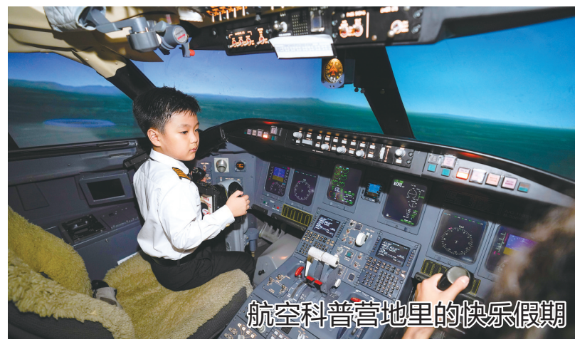
航空科普营地里的快乐假期

9月18日,工作人员在科特迪瓦阿比让国际机场转运中国国药集团供应的新冠疫苗。据悉,中国国药集团通过“新冠疫苗实施计划”供应科特迪瓦的81.6万剂新冠疫苗分别于17日和18日运抵阿比让。