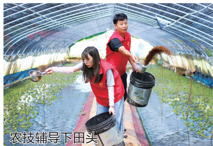
农技辅导下田头 天台县洪畴镇开展“我为群众办实事”实践活动,实施农技辅导员包村包片制度,鼓励党员干部深入田间地头解难题、促增收,至今累计下派农村指导员等农技干部30余人次,为42户农户提供技术指导,帮助解决生产养殖问题57个。图为近日,该镇农技干部指导帮助牛蛙养殖户进行牛蛙饲养。