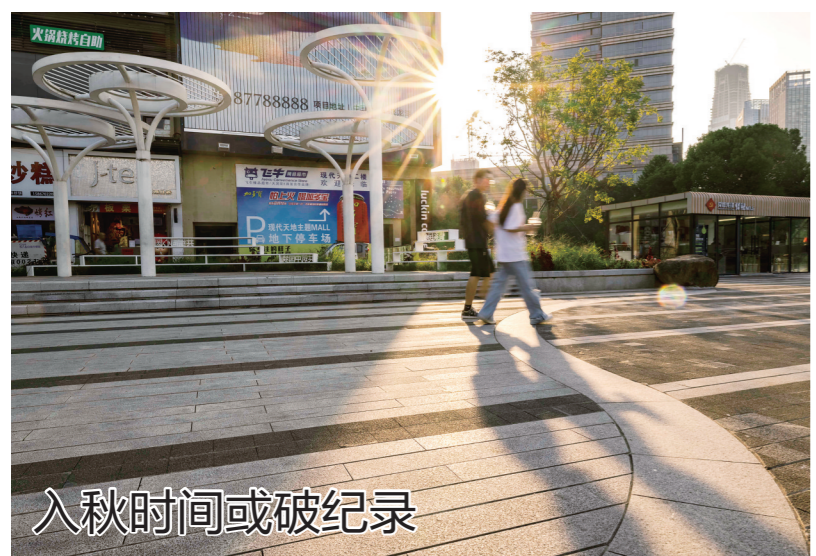
入秋时间或破纪录 国庆将至,我市大部分地区最高气温仍在30℃以上。据悉,秋季在气象上的划分标准是满足日平均气温或滑动平均气温小于22℃且大于或等于10℃。当年滑动平均气温序列连续5天小于22℃,则以其所对应的常年气温序列中第一个小于22℃的日期就是秋季的起始日。目前来看,台州今年入秋时间可能破历史纪录。图为椒江城区,市民在烈日下匆匆走过。

7月17日19时,S9苏台高速台州段前山隧道内,一辆黑色轿车变道时刮擦了一辆白色SUV,两车损失不大,双方本应快速撤离到安全地带后再协商处理,可他们立即将车停在了第一和第三车道。当时正值车流高峰,三车道的隧道只有中间车道能够