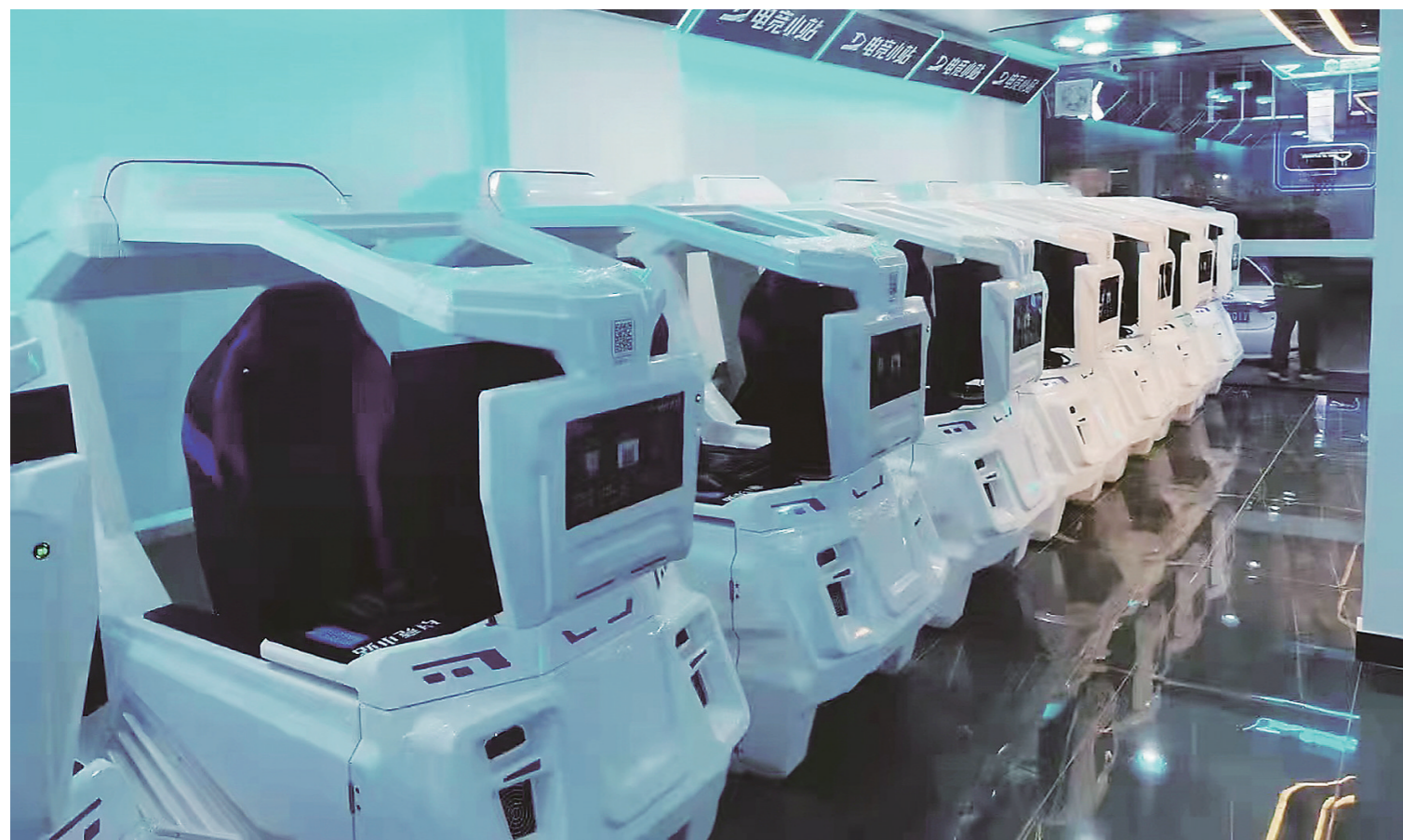
目前,全国已有200多家“电竞小站”。