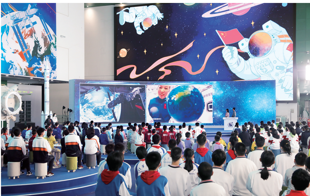
12月9日,学生们在中国科技馆设立的地面主课堂听课。