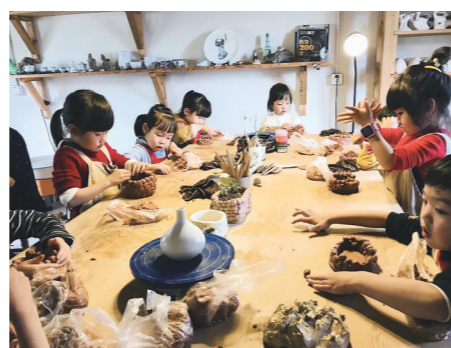
小朋友在店内体验陶艺制作。