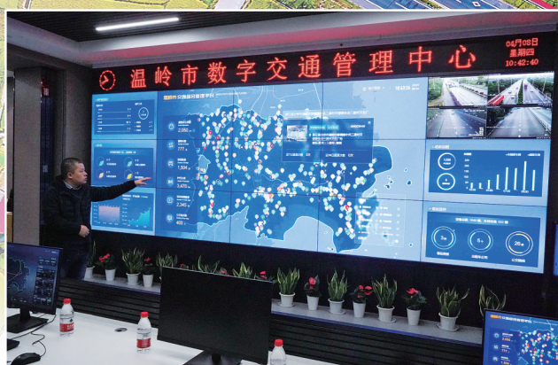
▲ 温岭市数字交通管理中心