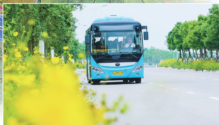
▲ 温岭市“四好农村路”

台县政府专门挤出2亿元,用于“四好农村路”建设。并将农村公路大中修、农村公路安保工程、农村公路危桥隧改造、港湾式候车亭等工程纳入PPP项目,有效缓解农村公路筹资难题。