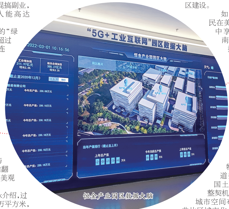
恒金产业园园区数据大脑

城市品质提升,把改善人居环境当成重点民生实事来办。根据辖区空间规划调整契机,进一步塑优