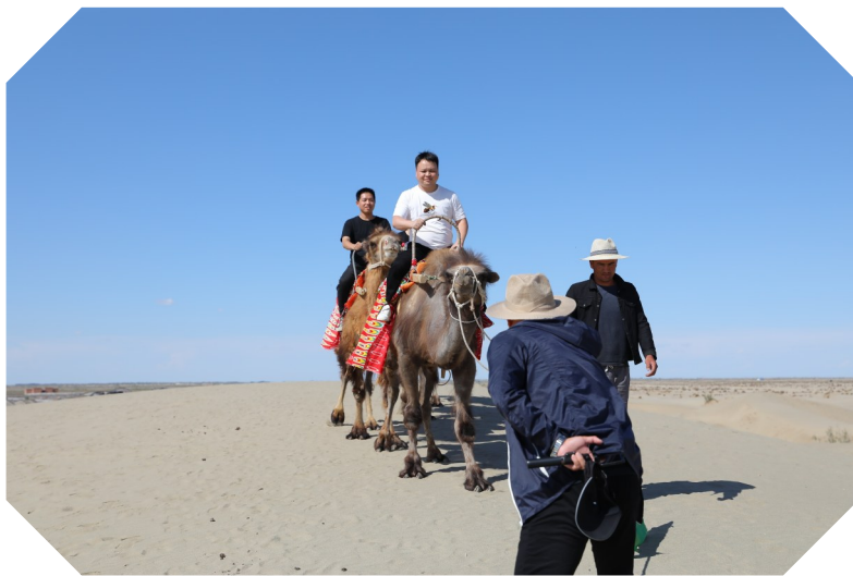
在夏日的沙漠中,游客过了一把骑骆驼的瘾

团如意湖景区等地安排了配套设施建设项目,梯次推进A级景区、全域旅游示范区、乡村旅游重点村等国家级、自治区级品牌等创建工作,助力打造“旅游目的地”“康养首选地”,不断提升阿拉尔的旅游知名度。