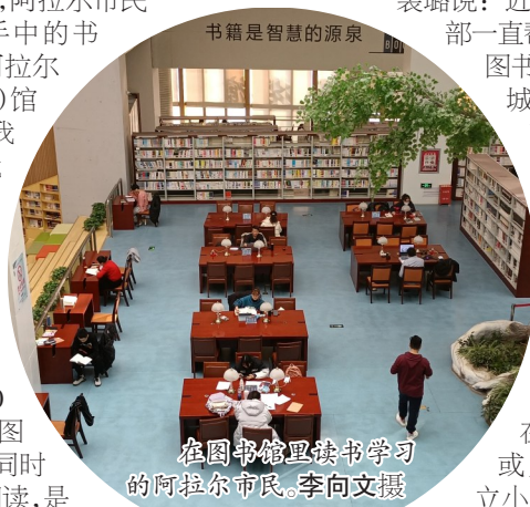
在图书馆里读书学习的阿拉尔市民

为进一步扩大书籍资源的覆盖范围,方便群众阅读,指挥部今年将继续在重要公共场所或人群密集地设立小型图书馆、阅读室等。目前,已拟在塔里木机场、阿拉尔火车站等地设立“城市书房”,让旅客在候机、候车过程中将目光从手机移到书本。