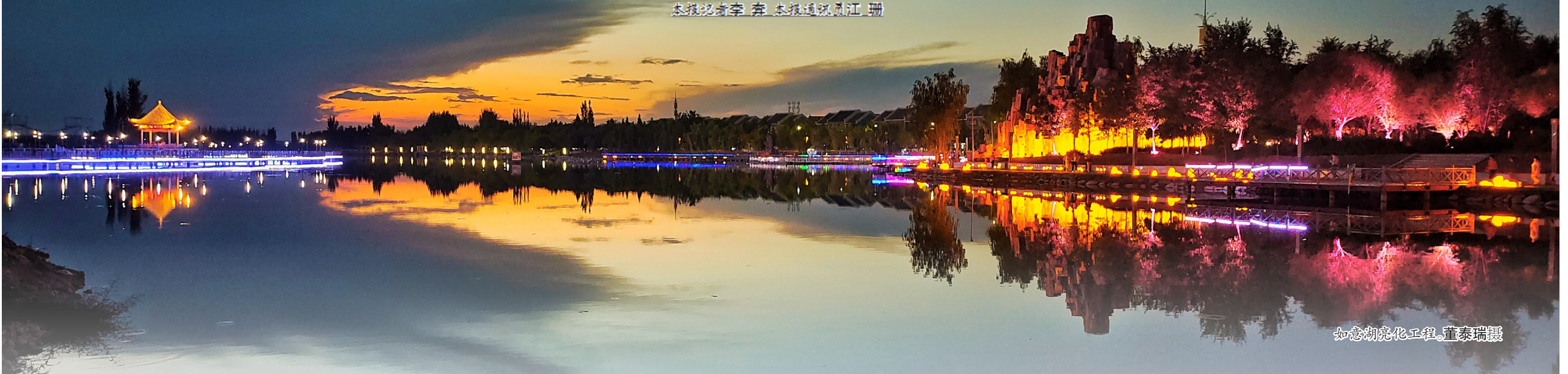
如意湖亮化工程

文化是一个民族的灵魂,是一方水土、一座城市文明程度的重要体现。旅游是促进不同区域交流发展的有效途径,文化也正因此与旅游相生共兴,相辅相成。在台州市对口支援新疆生产建设兵团第一师阿拉尔市的十余载里,文化旅游援疆一直是助力阿拉尔产业发展的重要工作,一次次翻山越岭,一场场交流碰撞,文旅援疆工程激活了阿拉尔旅游市场“一池春水”,让两地人民建立起深情厚谊。