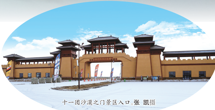
十一团沙漠之门景区入口

在台州援疆的助力下,2021年,阿拉尔旅游行业稳中求进,整体呈现向好态势,累计接待游客421万人次,实现旅游总收入22.76亿元,旅游人次和收入在南疆兵团排名第一。今年,第一师阿拉尔市将坚持规划引领,全力打造旅游精品,以“台州万人游阿拉尔”活动为抓手,让更多疆外游客了解阿拉尔,爱上阿拉尔。