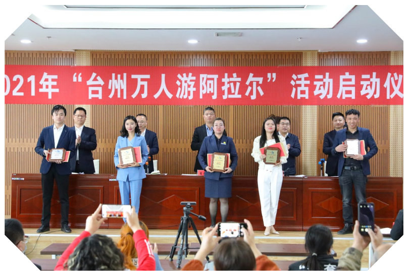
在2021年“台州万人游阿拉尔”启动仪式上,援疆指挥部公布了2020年本地旅行社、文旅服务单位获奖名单并颁奖,李奔摄