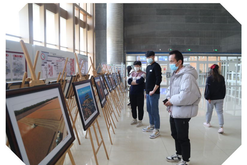
2022年2月22日,“我爱新疆”台州·阿拉尔摄影展在阿拉尔巡回展出

绵绵用力,久久为功。台州市援疆指挥部将坚持以文化人、以文育人,深入探索城市文化建设和全面提升城市文明层级的实现路径,强化文艺活动在思想引领、政策引导、凝聚人心方面的积极作用,推动文化润疆持续不断向纵深发展。