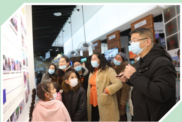
台州援疆干部邀请少数民族亲戚参观三五九旅屯垦纪念馆,感受红色文化,增进民族友情。