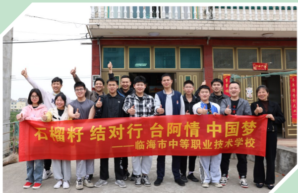
第一师阿拉尔职业技术学校烹饪专业四位学生赴台州跟班学习。