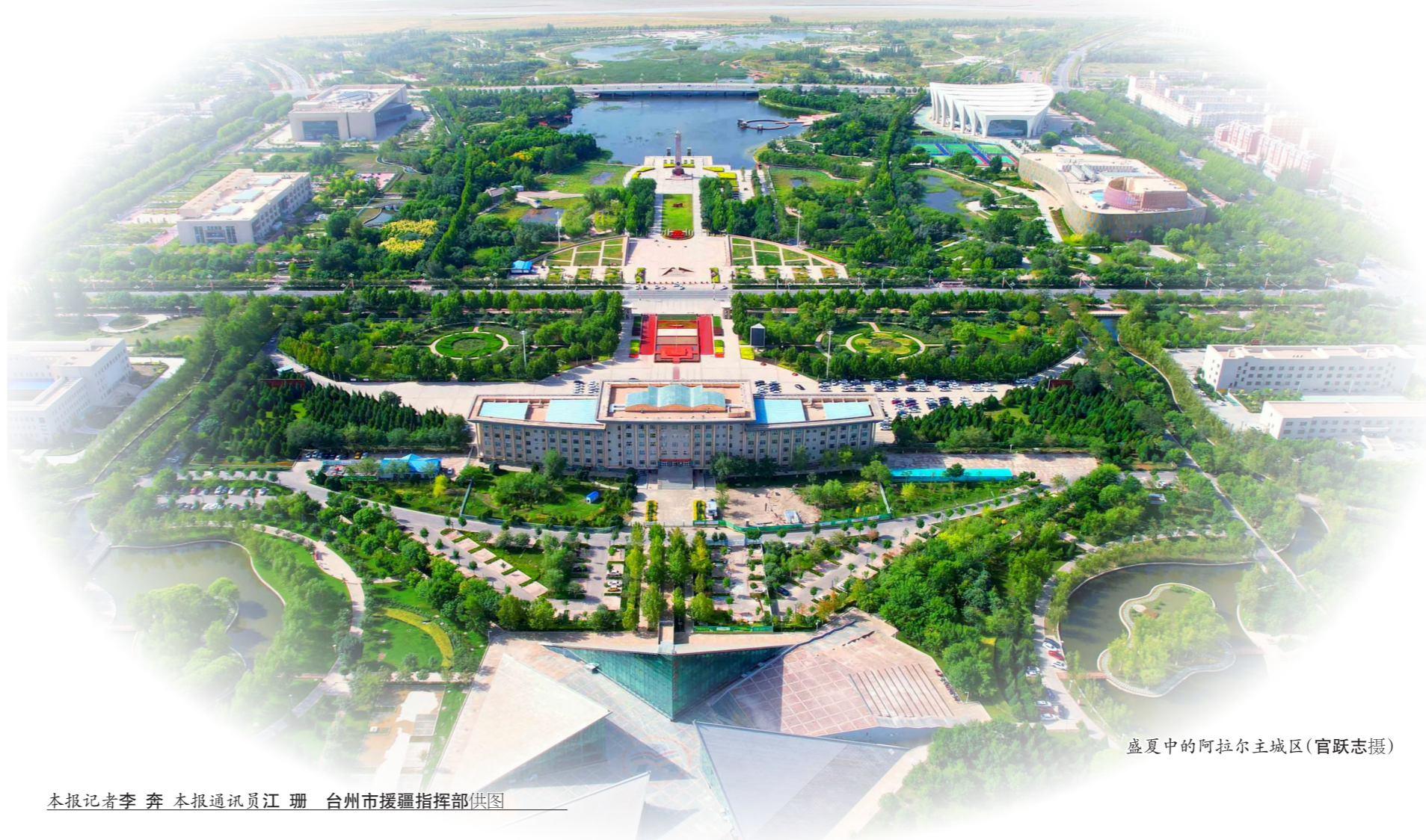
盛夏中的阿拉尔主城区