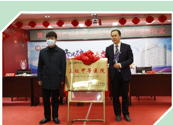
第一师阿拉尔医院三级甲等综合医院揭牌仪式。