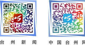
台州新闻 中国台州网