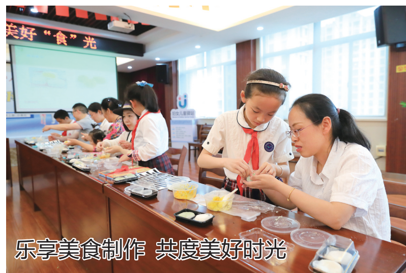
乐享美食制作 共度美好时光

本次蓝莓采摘节的直播助农行动,也是妇联开展村播计划的一次积极实践。他们希望通过推出特色好产品,在各类带货直播中提升巾帼主播的实操能力,扩大本土特色产品影响力,促进本地人才与产业对接、本地产品与营销对接。