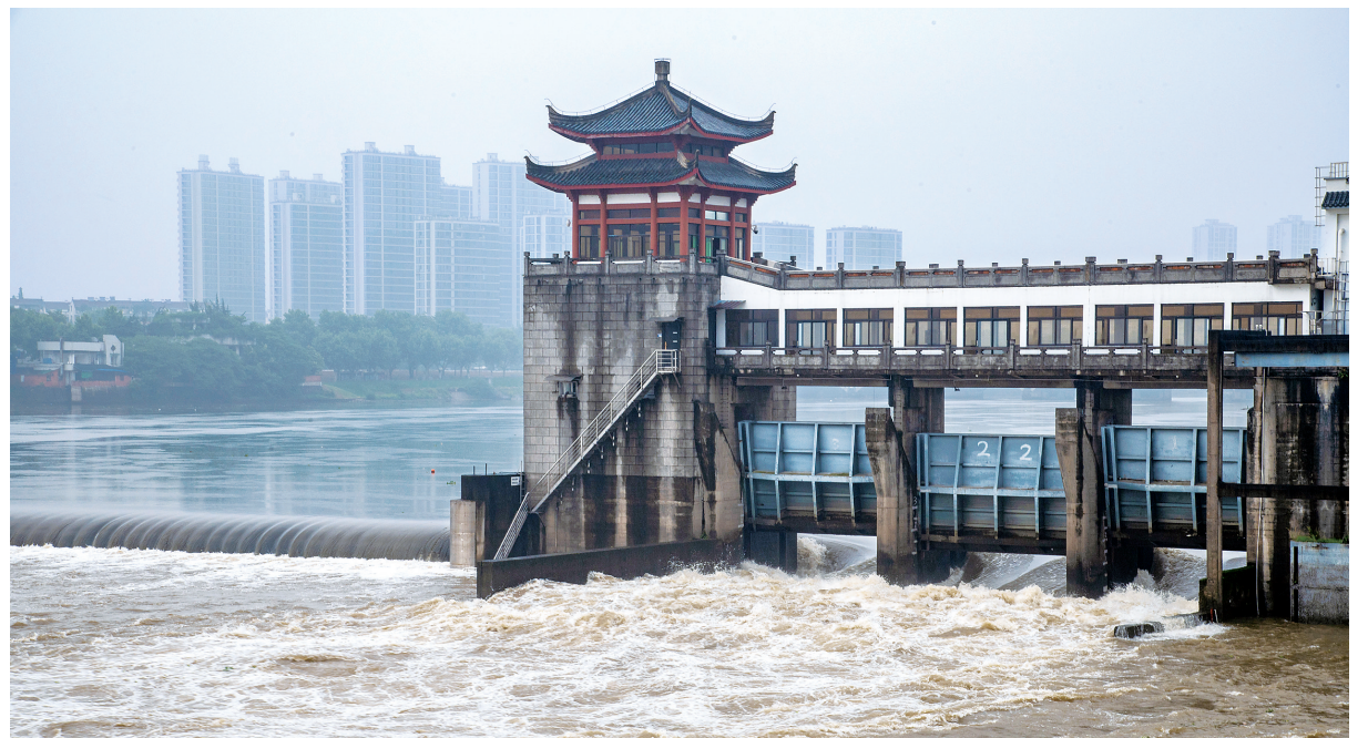
金华：强降雨水位上涨 保安全紧急泄洪

5月29日，浙江省金华市金华江河桥枢纽，正在紧急放水泄洪。5月27日开始，浙江省金华市各地陆续出现强降雨天气过程，境内的衢江、金华江、兰江等河流水位快速上涨。当地果断采取紧急放水泄洪措施，确保沿岸人民群众生命财产安全。