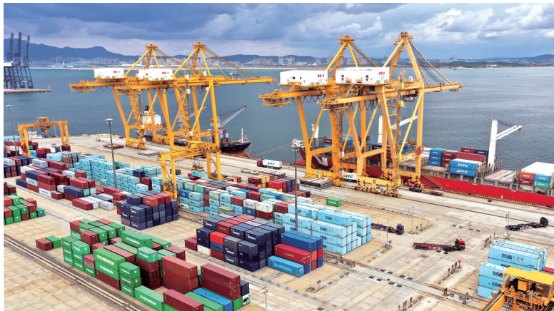
2020年9月24日，货轮在大连港大连集装箱码头有限公司港口装卸集装箱(无人机照片)。