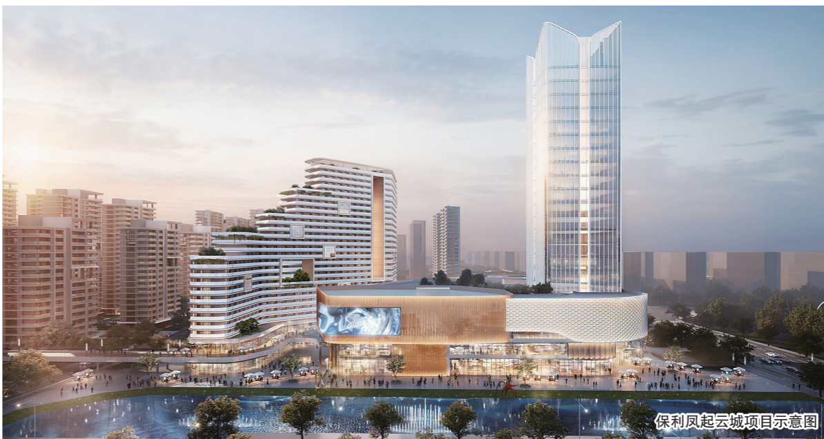
保利凤起云城项目示意图

企,保利还有着着一股子“民族担当”。在屡见不鲜的“规划丰满,交付骨感”背景下,保利·凤起云城摒弃传统陋习,规避第三方运营全盘运营的弊端,打造“平台+管家”数字化新模式,全方位统领运营,坚持“以人为本”服务社区居民。