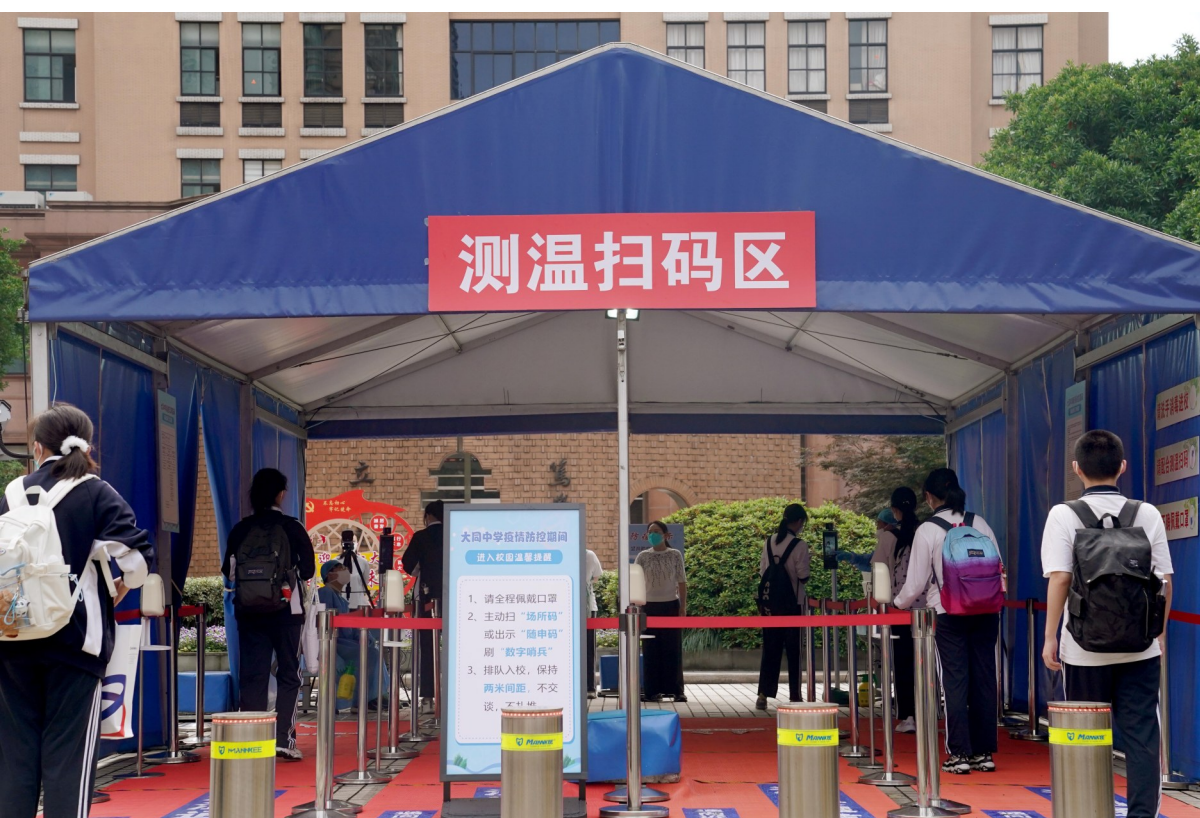
6月6日,上海市大同中学的高二、高三年级的学生在校门口分流入内。

目前,上海市、区两级教育、疾控部门已建立中小学校园疫情应急处置机制,各区将根据返校师生人数,按一定比例储备条件较好的宾