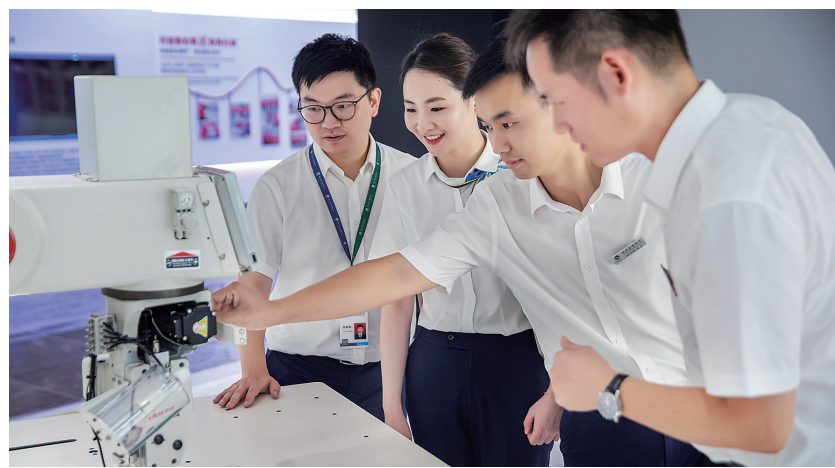
椒江农商银行客户经理走进川田智能科技有限公司了解金融需求。

在数字化改革战略引领下,椒江农商银行不断探索,通过金融产品和服务模式创新,搭建政务、民生服务与金融服务共通、共享平台,打通金融助力服务“最后一公里”,打造农商行融入政府数字化改革的金融样板,为促进共同富裕提供强有力的金融支撑。