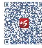
扫码收看更多内容

共同富裕不仅要围绕主责主业,也要尽最大努力去反哺社会。椒江农商银行近年来累计向社会公益捐资2190万元,如通过椒江区慈善总会设立“社会共治公益项目创投基金”,为社会组织参与社会共治公益项目提供100万元资金支持;向椒江区红十字会捐款60万元,用于疫情防控等工作。