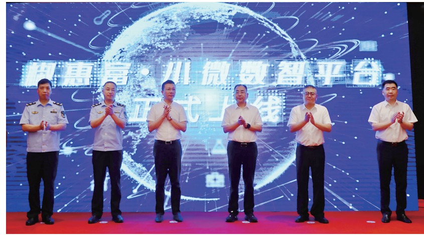
“椒惠富”小微数智平台上线,助推小微主体高质量发展。

椒江农商银行通过做好续贷转贷、实现灵活还款等措施,保证企业贷款稳定性的同时,还进一步提升小微企业的融资便利度,解决担保难题。