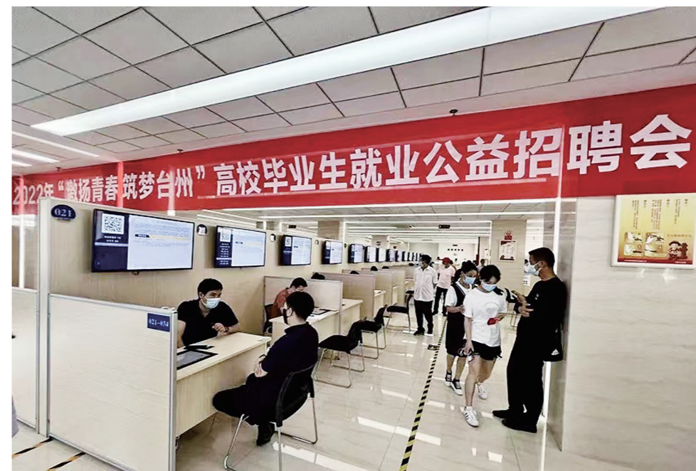
2022年“激扬青春 筑梦台州”高校毕业生就业公益招聘会现场。

对于来台州工作的高校毕业生,可按规定的标准在“台州人才在线”申请安家补贴、租房补贴等。这对于刚工作不久的毕业生群体来说,是一项力度不小的帮扶政策。