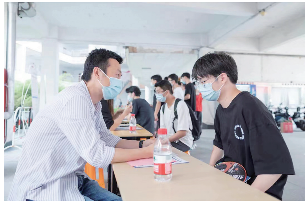
招聘会现场,毕业生与企业负责人面对面交流。

今年6月至8月,我市持续推进云招聘活动,在台州人才网、台州就业招聘网,以及市、县公共人才网站开设“百日千万网络招聘专项行动”“民营企业招聘月”“就业见习”等高校毕业生就业专栏,组织开展直播带岗、空中宣讲、云面试等活动,在线上也能毕业生求职就业保驾护航。