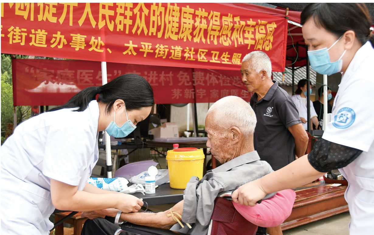
街道办工作人员为老人做健康体检