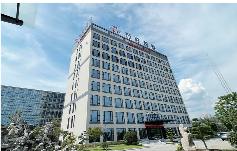
图为万胜智能大楼。

电度表的客户很单一,国内市场就是国家电网、南方电网及其下属公司。随着数字电网加速发展,“双碳”经济体量大增,能源计量领域迎来