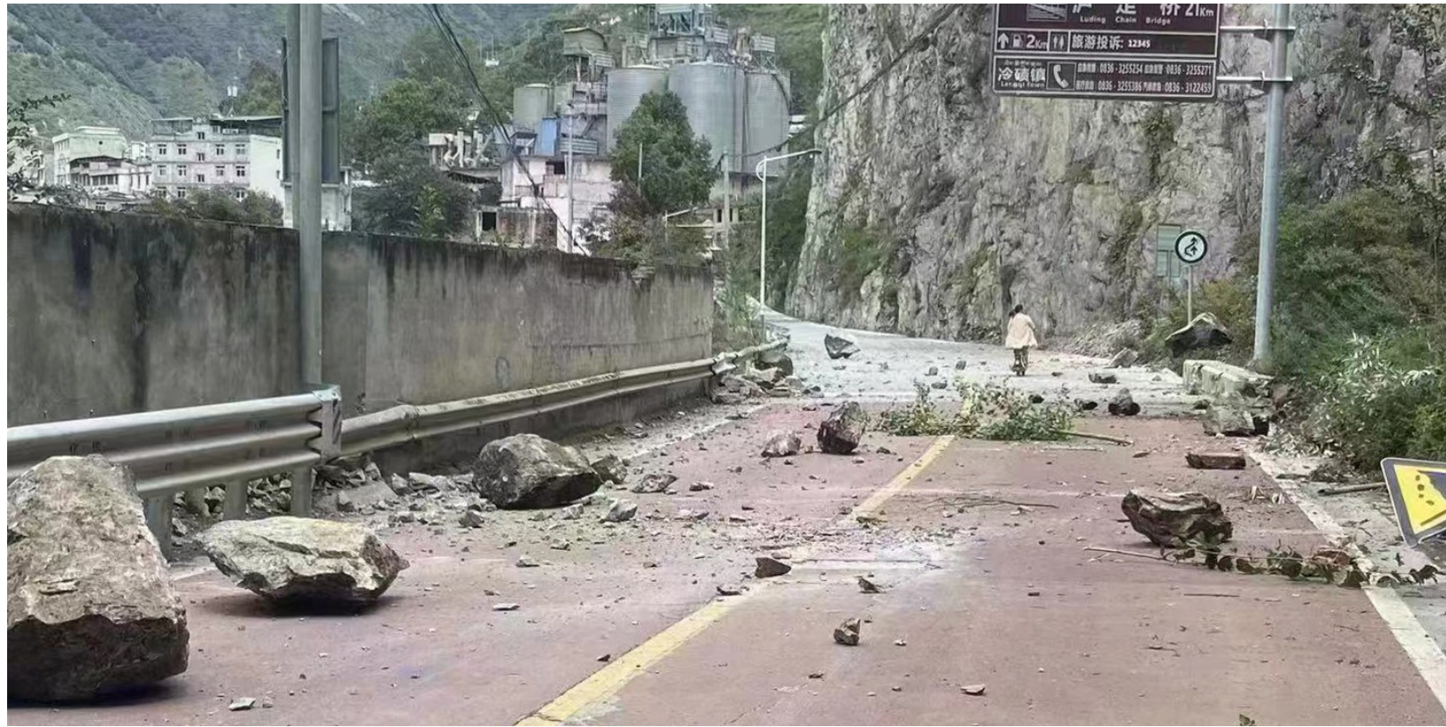
山石摔落在四川省甘孜州泸定县冷碛镇附近的道路上(9月5日摄)。

根据习近平指示和李克强要求,应急管理部、自然资源部、国家卫生健康委等部门已派出工作组赶赴灾区指导救援救灾。四川省、甘孜州已组织救援力量开展救灾工作,并紧急调拨帐篷、棉被、折叠床等救灾物资运抵灾区。抗震救灾各项工作正在紧张有序进行。