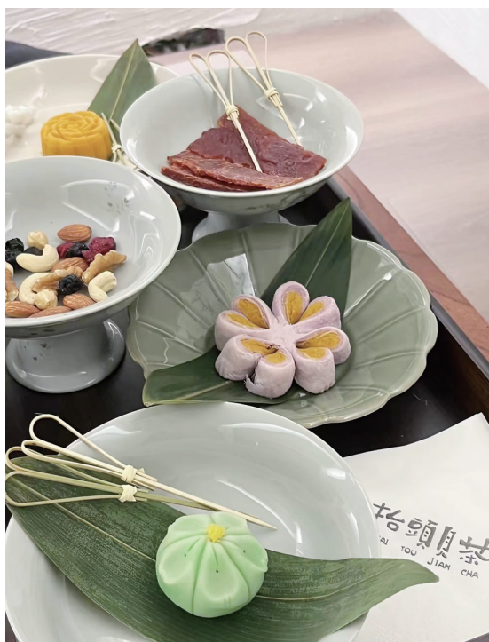
以宋代茶果子为灵感的月饼