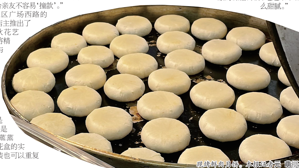
现烤鲜肉月饼。

“我们对传统的流心月饼进行改良,加入了更多创意口味,反复调试了大半个月才敲定最终的口味。”店主小怡表示,“我们还根据顾客的需求,推出了更健康的低糖月饼,吃起来不那么甜腻。”