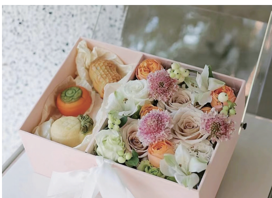
中秋花艺月饼礼盒。

在椒江区广场西路的一家花店,店主推出了一系列中秋花艺月饼礼盒,将精美的花盒与月饼相结合,创意满满。其中,一款蒸笼花盒引人注目,上层是插花,下层是月饼,取的是花好月圆、蒸蒸日上之意,花盒的实用性高,包装也可以重复利用。