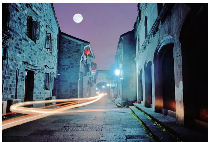
月夜漫步临海紫阳古街,别有韵味。

月夜漫步,也是赏心乐事。沿着椒江海口老街的青石板街漫步,沿街火红的灯笼随风晃动,和天上的圆月遥相呼应,一同照亮初秋的夜晚;或是逛一逛葭沚老街,感受老街改造后中秋的良辰美景。只要与家人团圆,无论是在家门口的公园或者广场漫步赏月,都是幸福感满满。