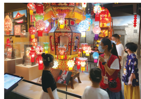
台州市博物馆的小小讲解员向参观者讲述台州历史。