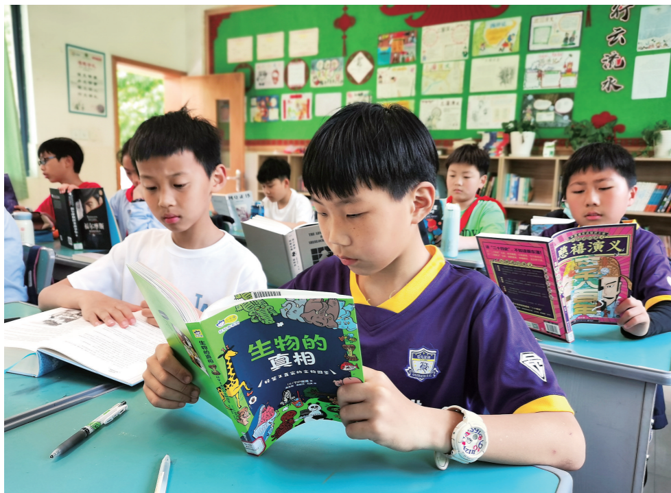
台州市图书馆策划建设“班级书香驿站”，已为全市9所小学的35个班级提供外借图书。