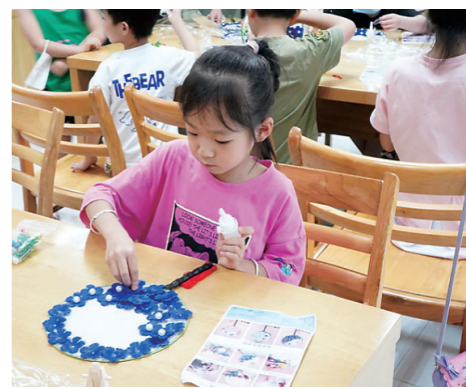
台州市图书馆组织的“益智坊——扇动夏天·悦享清凉”活动现场。