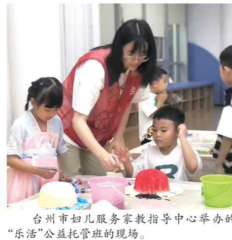
台州市妇女儿童服务家指导中心举办的“乐活”公益托管班的现场。