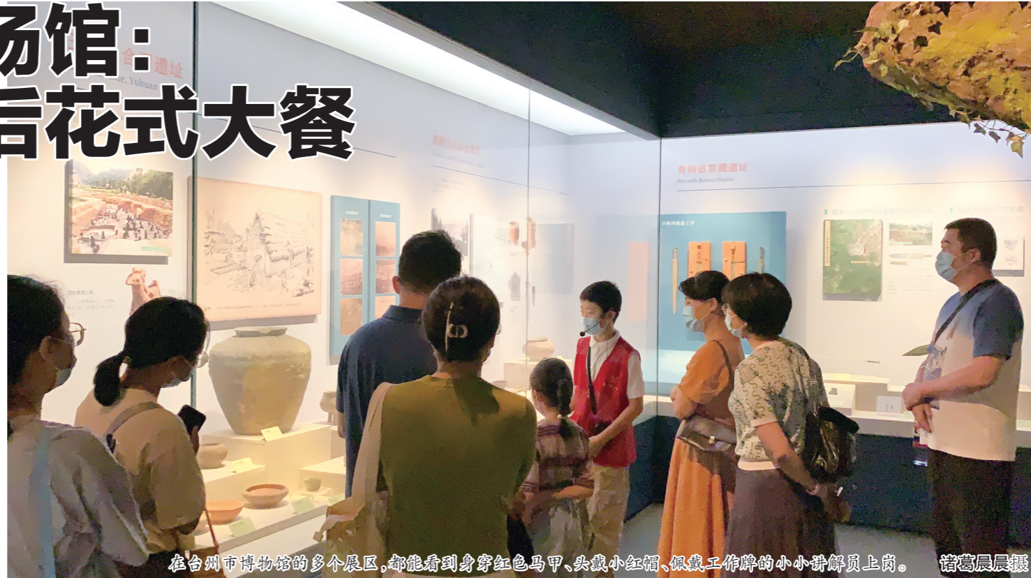
在台州市博物馆的多个展区，都能看到身穿红色马甲、头戴小红帽、佩戴工作牌的小小讲解员上岗。