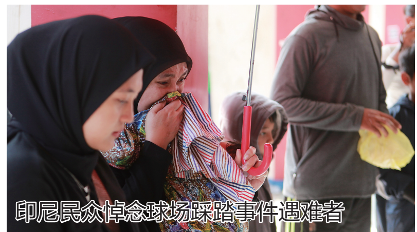
印尼民众悼念球场踩踏事件遇难者

白俄罗斯总统卢卡申科4日在明斯克召开军事安全会议时指出,俄罗斯发动的特别军事行动强度没有减弱,乌方在西方军事援助下也在作出反应。当前的形势正在恶化。他说,乌克兰在俄白边境部署了1.5万名军事人员并对白方进行侦察。(参与记者:赵冰 李东旭 李铭 耿鹏宇 鲁金博)