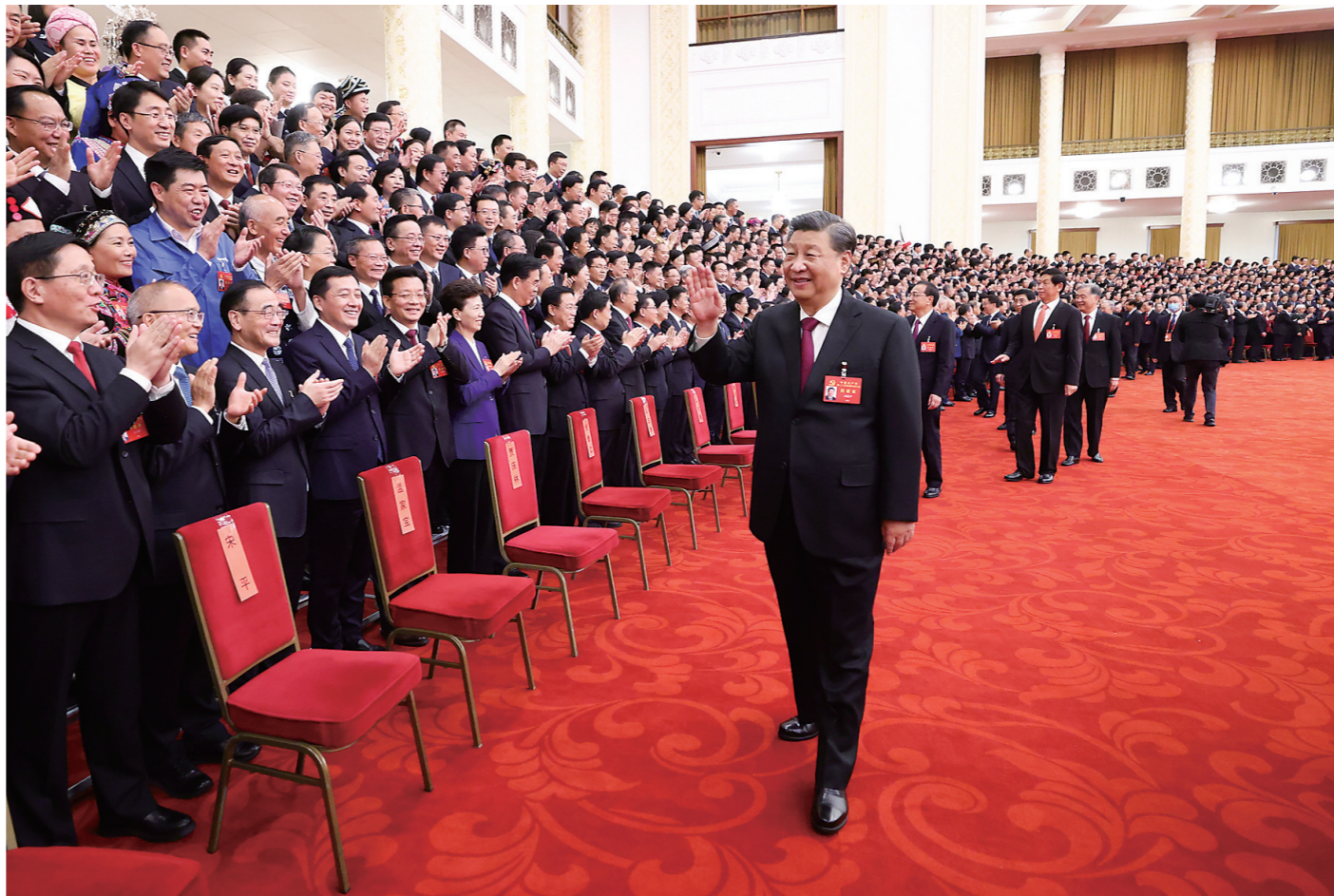
10月23日下午,中共中央总书记、国家主席、中央军委主席习近平等领导同志在北京人民大会堂亲切会见出席党的二十大代表、特邀代表和列席人员,并同大家合影留念。