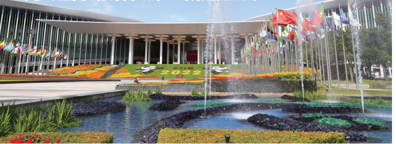
这是10月24日拍摄的国家会展中心(上海)南广场。近日,位于上海青浦的国家会展中心(上海)场馆外部进博会主题装饰工程进入收尾阶段,包括南广场在内的四个出入口都已装饰一新,迎接即将开幕的第五届中国国际进口博览会。