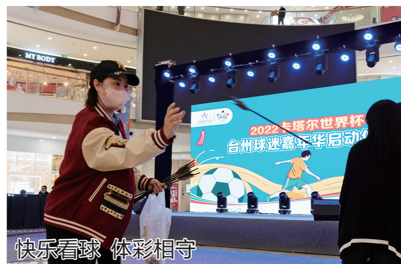
快乐看球 体彩相守 11月16日晚,台州体彩2022卡塔尔世界杯台州球迷嘉年华暨空韵舞蹈体彩文化启动仪式在椒江区万达广场举行,本次活动旨在让更多的市民了解世界杯,关注世界杯及相关活动。图为市民参与现场的投篮互动。

和养老院相结合,养老院里有康复护理,还有专业医生随时随到,她便住了进来。 亭旁康养联合体由亭旁卫生院、亭旁康养联合体而来。2020年7月投入使用,是台州市首家新型康养联合体,也是国家卫健委批准的“老龄健康医养结合远程协同服务”试点机构。 该机构整合政府、医院、养老机构等资源,通过医养结合、公建民营的方式,为老年人提供与医疗服务相衔接的康复护理、生活照料一体化养老服务。