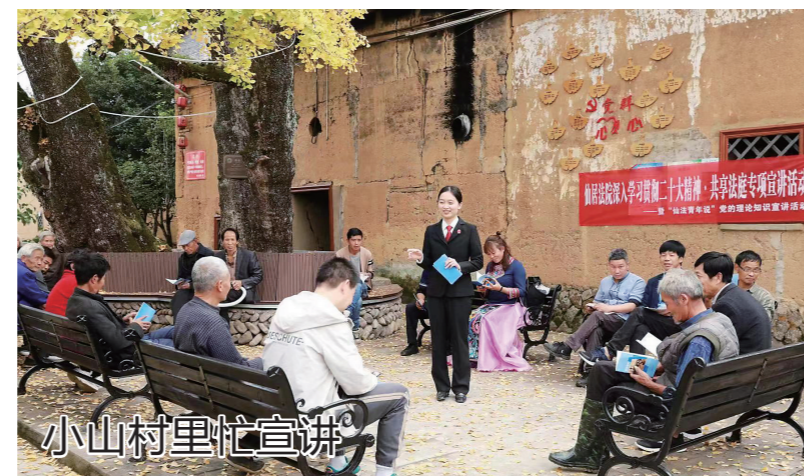
小山村里忙宣讲 安岭乡地处台州、温州、丽水交界。近日,仙居县人民法院组织干警前往该乡,宣讲党的二十大精神并开展专项普法活动。图为在新表门村的千年银杏下,法官正在解答村民法律法规方面的疑惑。