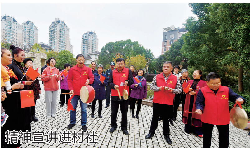
精神宣讲进村社 11月16日,路桥区路北街道组织民间艺人、党员宣讲团,来到马铺社区,采用快板、三句半、方言故事等形式,以通俗易懂的语言、活泼的手段,向村社百姓宣传党的二十大精神,让大会精神家喻户晓,深入人心。