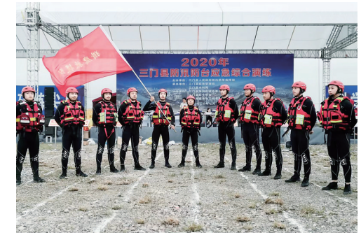
三门县雄鹰救援队