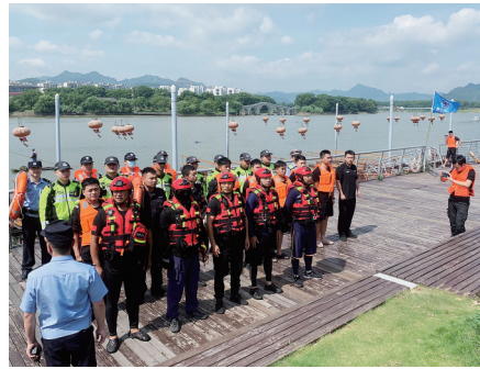
天台县曙光应急救援队