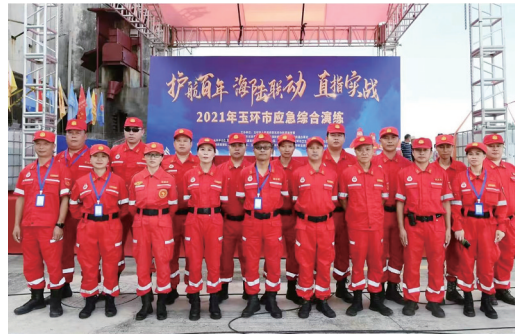
玉环市红豹志愿救援队