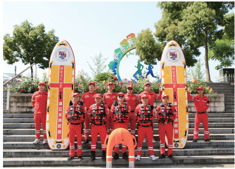
台州市黄岩区水上救援协会