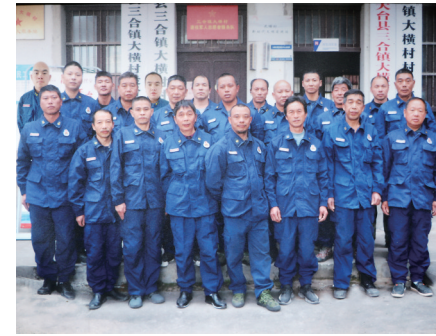
天台县三合镇大横应急救援消防队